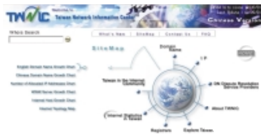
The Site Map of English Version

Shiao-Yang Lee / TWNIC anthony@twNIC.net.tw