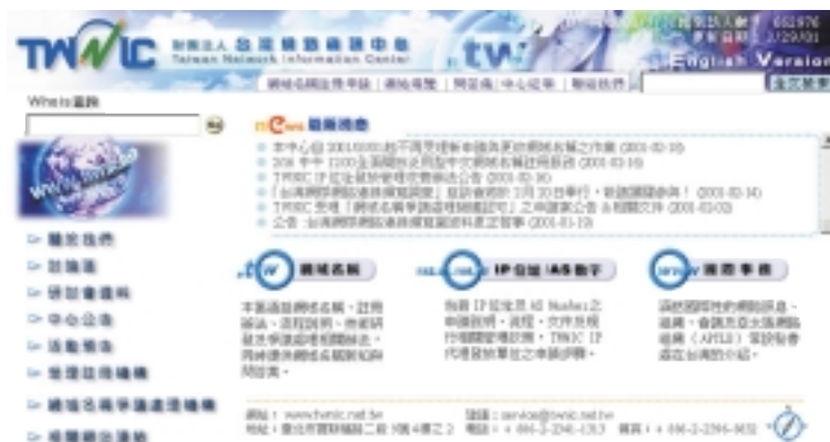
台灣網路資訊中心 中文版網站 首頁

法人一週年，為加強網站內容和結構，並配合三月二十九日『2001網際網路研討會-邁向e世代網路新紀元』週年慶活動；台灣網路資訊中心網站擬計劃進行中、英文網站的改版工作，除配合週年慶活動外，也希望藉由內容的更新和結構的重整，讓台灣網路資訊中心網站能以全新的面貌在三月二十九日重新服務網際網路使用族群。