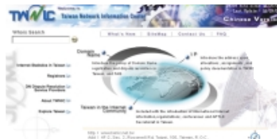
The Homepage of English Version