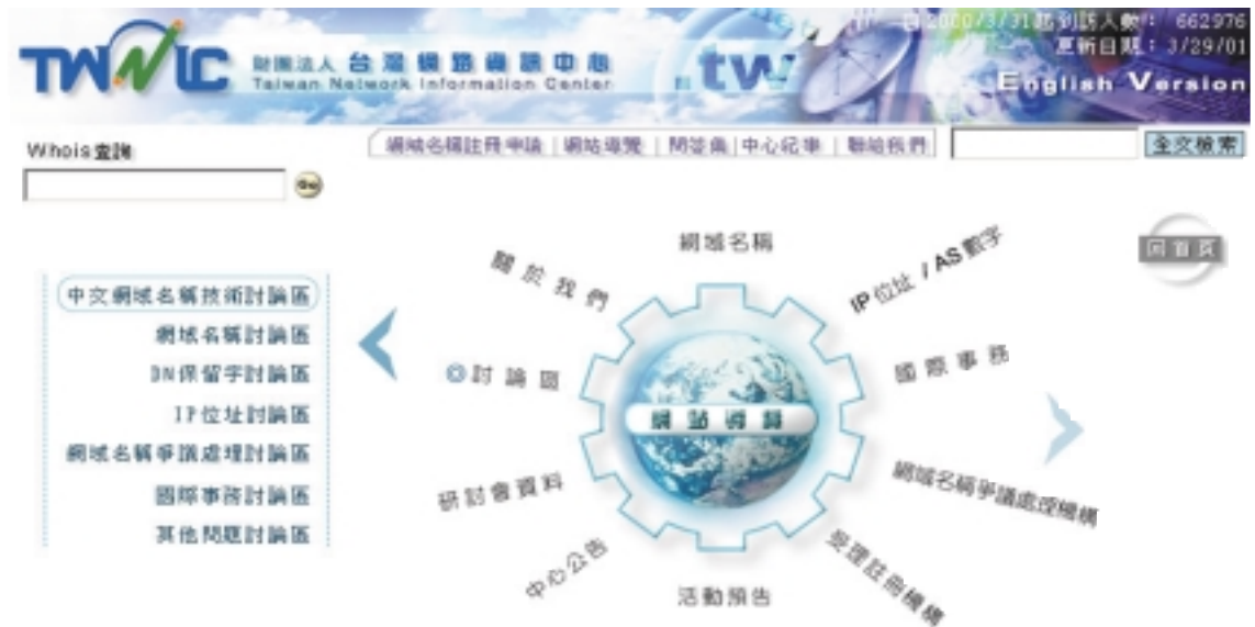
台灣網路資訊中心 中文版網站導覽

來，有助於網際網路使用族群了解台灣在國際網路社群的定位點。其中在 APTLD 項目中，就特別的介紹了 Asia-Pacific Top Level Domain Forum (APTLD) 這個亞太地區的國際網路組織，尤其在台灣網路資訊中心於去年（2000年）十月當選為未來兩年的常設秘書處後，更彰顯出台灣在國際網路社群裡地位的重要性。因此，在改版計劃中，特別建構了 APTLD 項目，提供使用者 Asia-Pacific Top Level Domain Forum (APTLD) 詳實的介紹。