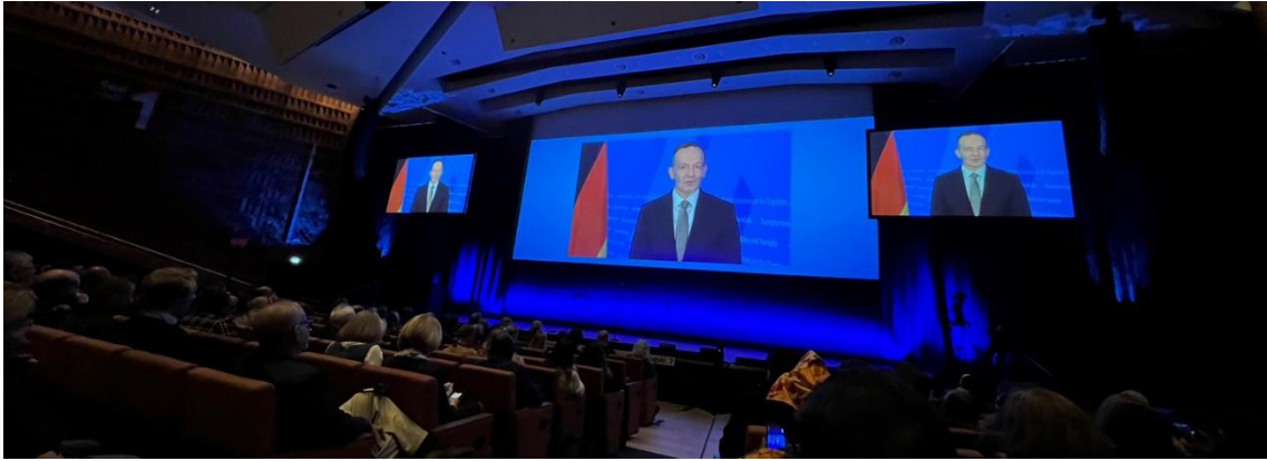
德國聯邦政府數位及運輸部部長 Dr. Volker Wissing 以錄影方式致詞