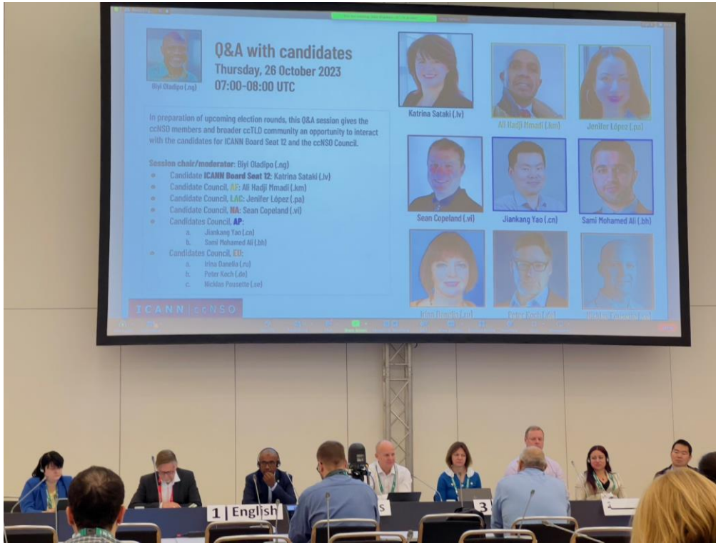
各候選人進行政見發表

為了即將到來的選舉，包含 ccNSO 推舉的 ICANN 董事(Seat 12)及 ccNSO 理事會各區域的 1 席改選，本場次安排各候選人進行政見發表，並接受 ccNSO 會員的現場提問。