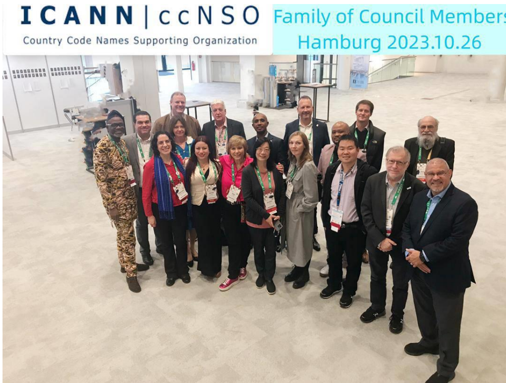
現任 ccNSO 理事會